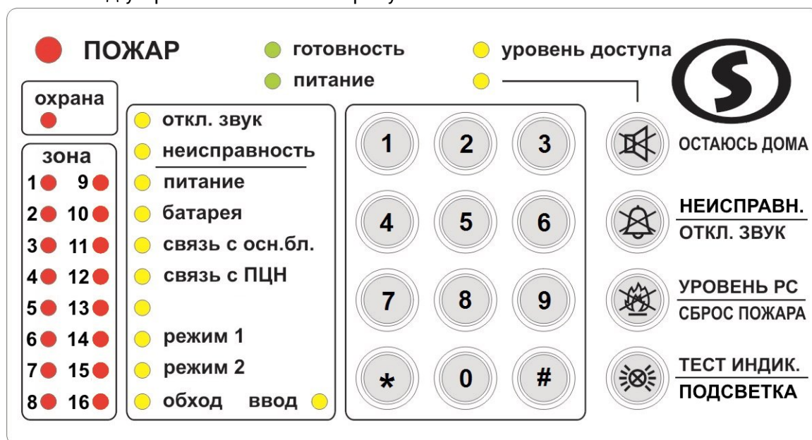
Рисунок 1. УИУ «Линд-9М2»

Внешний вид устройства показан на рисунке 1.