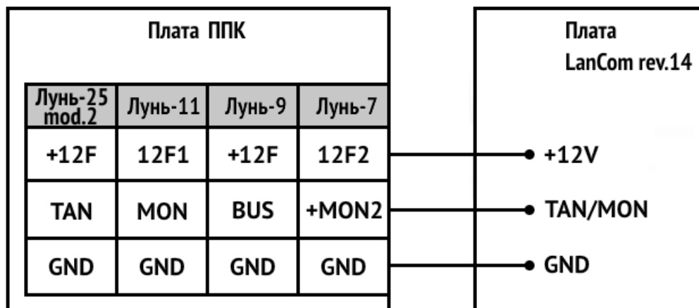
Рисунок 2: Схема подключения коммуникатора к ППК

Внимание! Выполнение требований данной схемы электрических соединений является обязательным. Не соблюдение данного требования может повлечь за собой отказ от гарантийных обязательств.