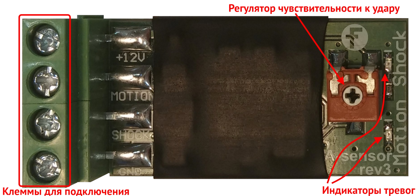
Рисунок 1. Внешний вид платы извещателя

Внешний вид извещателя показан на рисунке 1.