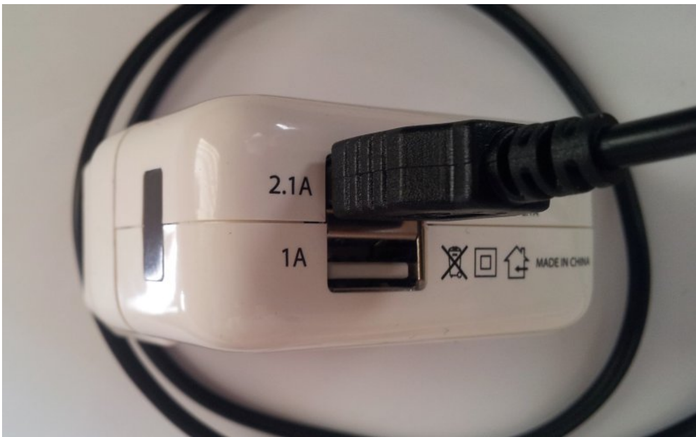
Рисунок 2. Подключение кабеля к зарядному устройству