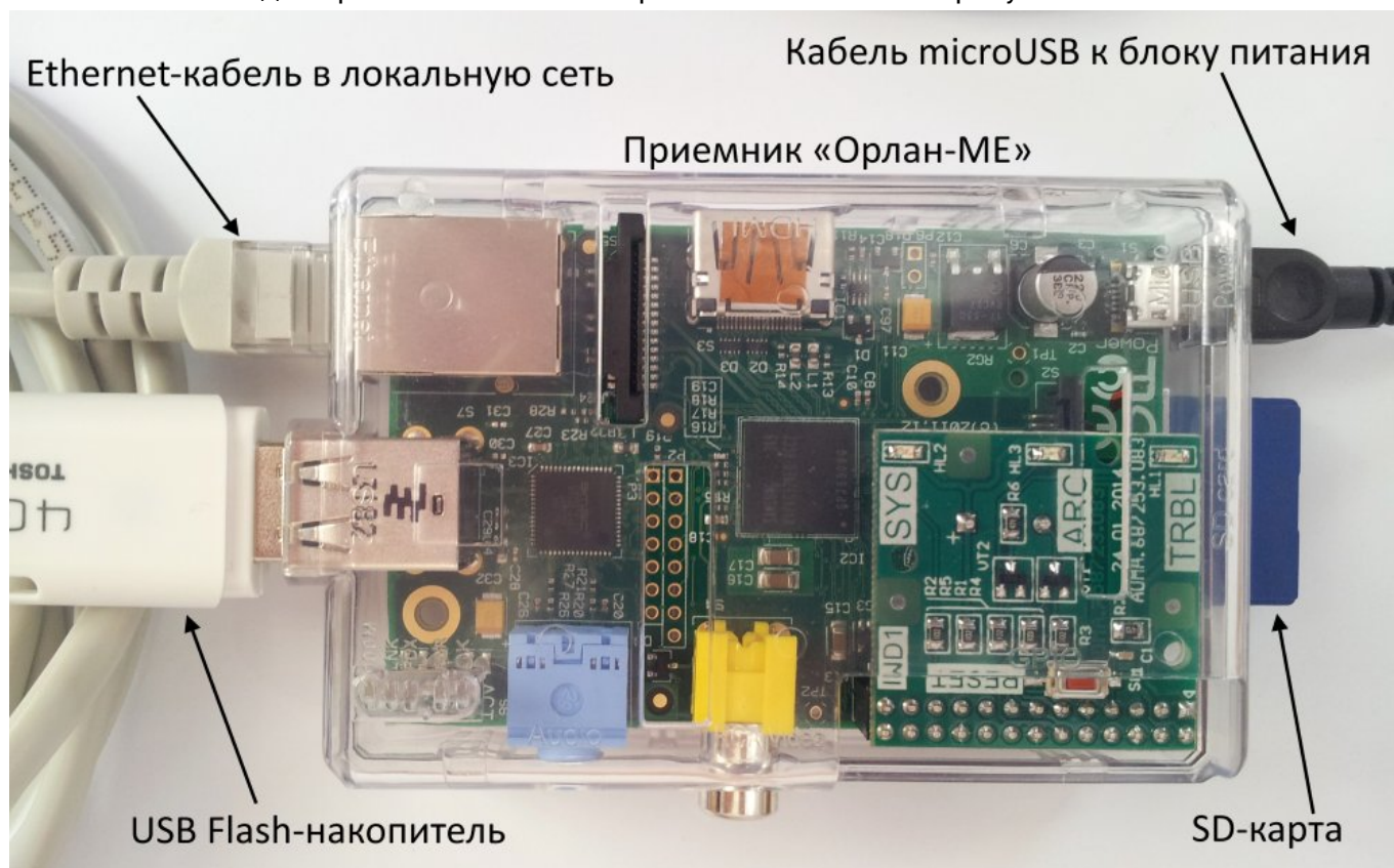
Рисунок 1. Внешний вид собранного комплекта приемника «Орлан-МЕ»

Внешний вид собранного комплекта приемника показан на рисунке 1.