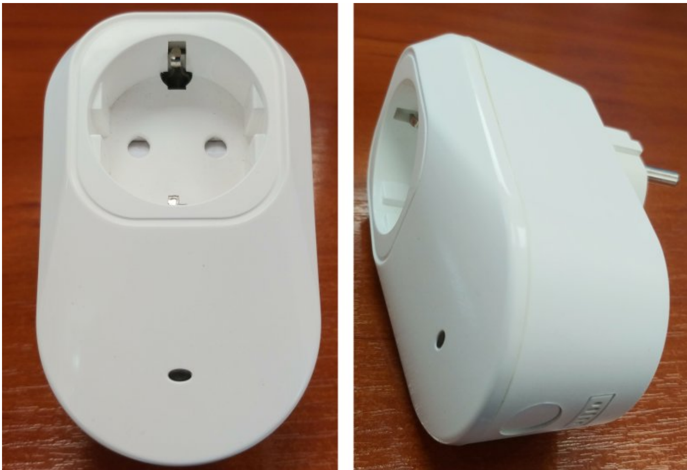
Рисунок 1. Розетка Socket-R

В корпусе установлена плата, многоцветный светодиодный индикатор и кнопка для инициации процесса связывания с радиоприемником «Lun-R».