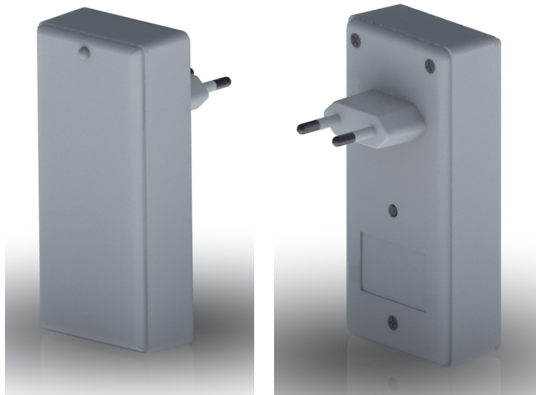
Малюнок 1. Ретранслятор “GT Repeater”

У корпусі встановлено плату з роз'ємом для резервного джерела живлення (акумулятора); світлодіодним індикатором та кнопкою запуску від акумулятора. Ретранслятор має вбудоване змінне джерело резервного живлення (акумулятор), що під'єднаний до плати ретранслятора.