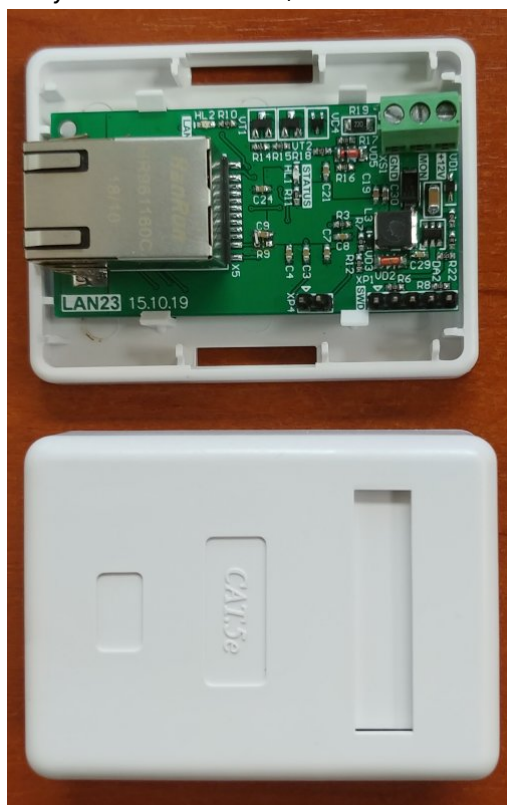
Рисунок 1. Внешний вид коммуникатора

Для подключения к ППК используются имеющиеся на плате коммуникатора клеммы (см. рисунок 1). Назначение клемм указано в таблице 2.